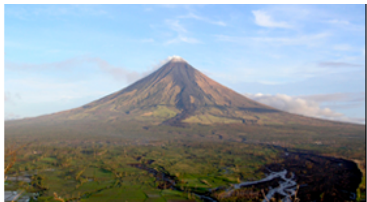
Llosgfynydd cyfansawdd Mayon, Indonesia.