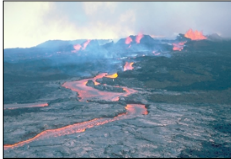
Echdorlad lafa gludedd isel, Mauna Loa, Hawaii

Mae gludedd lafa yn effeithio ar natur yr echdoriadau a'r mathau o losgfynyddoedd a grëir.